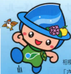
相模原市マスコットキャラクター 「さがみん」