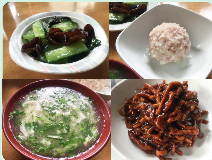
京酱肉丝套餐 (ジンジャンローズ定食) 550円

中国の四川省発祥の有名な料理。豚肉を豆板醤などで和え、それを麵にかけて食べる担担麵です。日本でもよく見かけますが、中国本場の担担麵はその辛さが特徴的で、癖になる一品です。