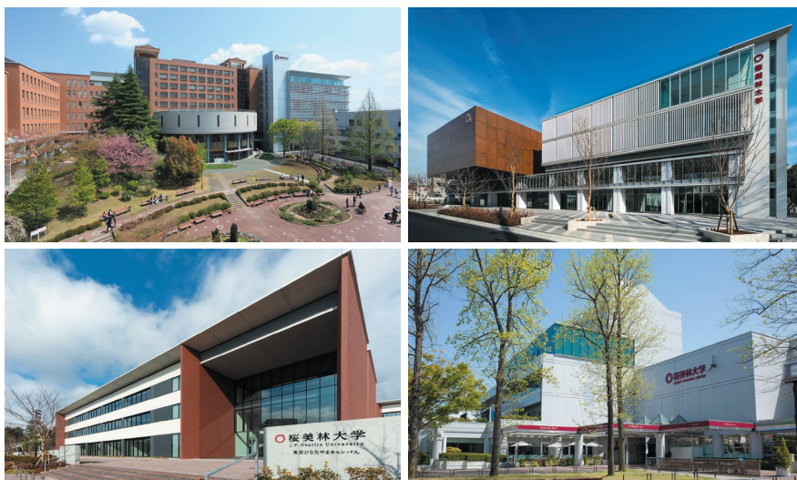
左上から時計回りに、町田キャンパス、新宿キャンパス、多摩アカデミーヒルズ(多摩キャンパス)、東京ひなたやまキャンパス

「リベラルアーツ学群」は社会で活躍するために必要な多角的な視点と、幅広く高度な専門知識による課題発見・解決能力を身につけます。「プロフェッショナルアーツ」は5つの学群で構成。国際社会で欠かせない語学を学び、1学期間(約15週間)の留学が必須となる「グローバル・コミュニケーション学群」。ビジネスの実務を模擬体験できる授業などを通じて、急速に多様化・進化する社会に対応する力を養う「ビジネスマネジメント学群」。メンタルサポートを含めた健康と福祉に関する専門家を育成する「健康福祉学群」。演劇、ダンス、音楽、ビジュアル・アーツを専攻できる「芸術文化学群」。それぞれ自分の夢や目標につながる知識や技能を修得していきます。