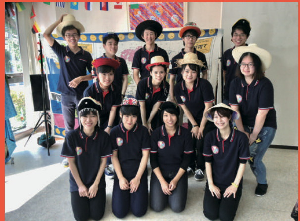
草の根プロジェクト学生スタッフ

また、会場では「草の根プロジェクトキッズファンクラブパスポート」と「ミッションシート」を配布します（詳しくは下記をご参照ください）。出張博物館は、子どもから大人まで多くの方の興味・関心を刺激し、体験を通じて異文化と親しみ、学ぶ場とすることを目指しています。ご家族・お友達と一緒に楽しみください。