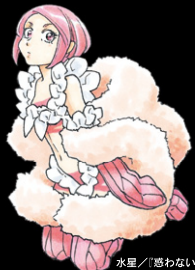
水星/『惑わない星』より

宇宙にちなんだ紙芝居上演(11:45~/14:00~/)や 「星のストラップ」作り(10:00~/13:00~/、各回先着50名)、 宇宙飛行士訓練服(レプリカ)で記念撮影コーナーも☆