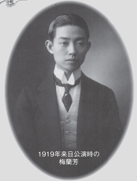
1919年来日公演時の梅蘭芳

梅蘭芳は、1923年の関東大震災直後、中国の京劇界に呼びかけて2日間の義捐公演を実施、その純益と私的にも寄付を行う。また1956年の訪日時に広島で被爆者から花束を贈られた後、自らの申し出で実現した被爆者、戦災孤児救済のチャリティ公演の収益は、広島と長崎に贈呈される。このように梅蘭芳は、日中芸術文化交流の道を切り開いただけでなく、日中友好の懸け橋としても知られている。