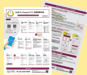
PayB for Campusアプリ初期登録手順

PayB for Campusアプリでお支払いされる場合は、必須の手続きです。同封の「PayB for Campusアプリ初期登録手順」をご参照の上、手続きを行ってください。