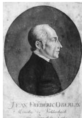
John Frederic Oberlin (1740-1826)