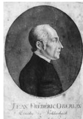
John Frederic Oberlin (1740-1826)