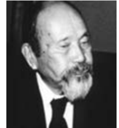
学園創立者 清水 安三 (1891 ~ 1988)

かくてキリスト教主義と語学、この二つをよく体得した人材を能うだけ多数教育せんとするのが、本学の建学の趣旨である。