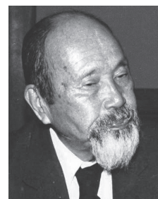
学園創設者 清水 安三 (1891～1988)

更に、語学だけでは足りない。己を愛する如く隣人も愛せよ、と教えるキリスト教を、みっちり教えるべきである。かくてキリスト教主義と語学、この二つをよく体得した人材を能うだけ多数教育せんとするのが、本学の建学の趣旨である。