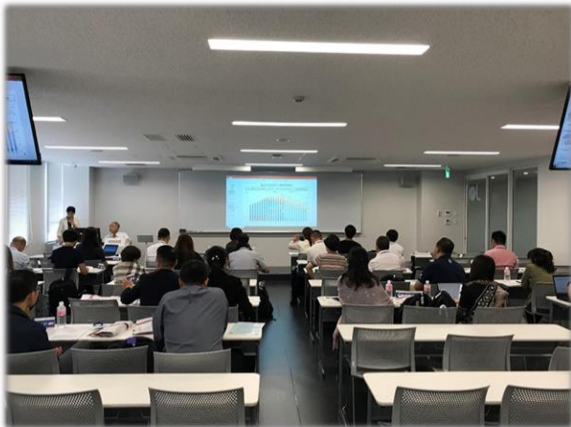
与清华大学联合举办“日本养老产业国际研修班（赴日）”（2019年）