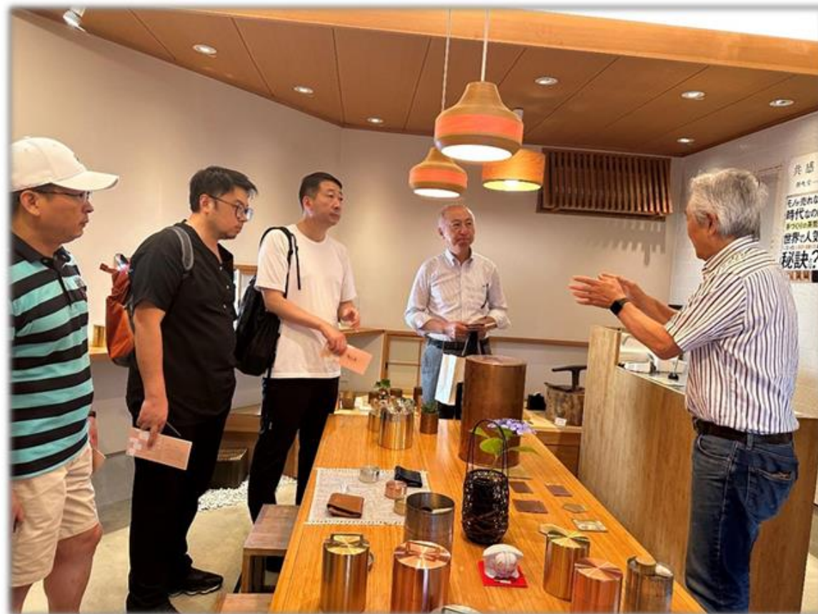
考察京都百年老铺 “开化堂 (手工制作茶叶筒)” (2023年)