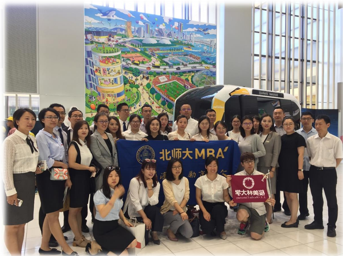
访问丰田汽车公司 (2019年)