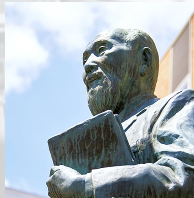
学园创始人 清水安三先生

樱美林大学前身为1921年创建于北京的崇贞学园（现为陈经伦中学），创始人为清水安三先生。现有在校大学生及研究生1万余人。学校设有商务管理学院、文理综合学院等七大学院，以及留生日语别科。大学院（研究生院）设有心理学、老年学、经营学等五个领域，着重培养高级人才。樱美林大学在国际交流以及学生满意度等方面的评价位居日本高校排行榜前列。大学常年积极开展国际合作，是日本社会和文教界中对中友好的重要机构。大学拥有6个校区，其中大学院（研究生院）的主校区是位于东京都新宿区的新宿校区。