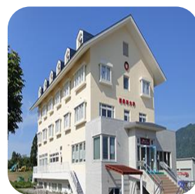
白马四季运动 体验校区

研究生院的主校区位于东京最繁华地区新宿附近，交通便利，环境幽静，配备全新的多功能教学设施。