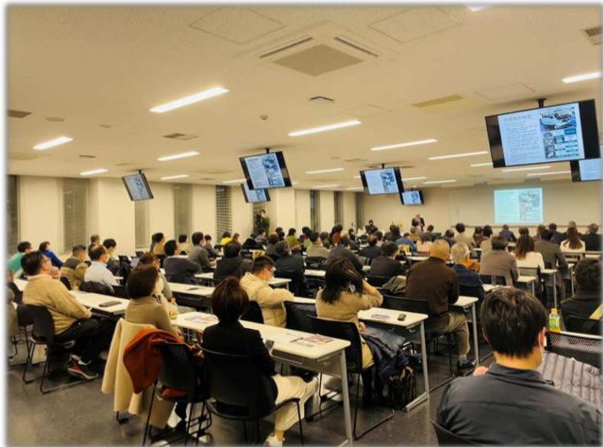
不定期举办“中日商务沙龙”，聚集各界商务人士形成交流平台 (图为第24届场景，2023年2月)