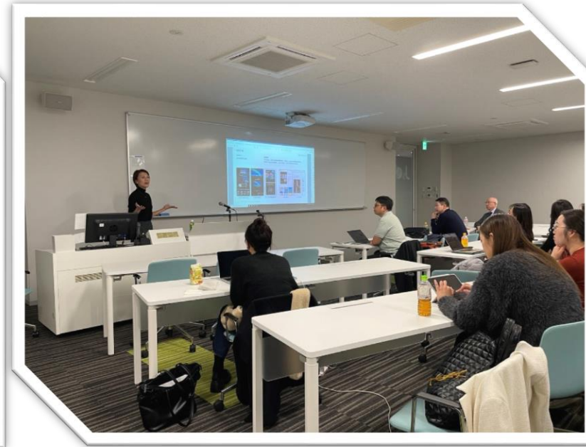
2023年12月，在日华人创业实践课。特邀互联网社交媒体创业人士到场授课，与学员们广泛深度交流。