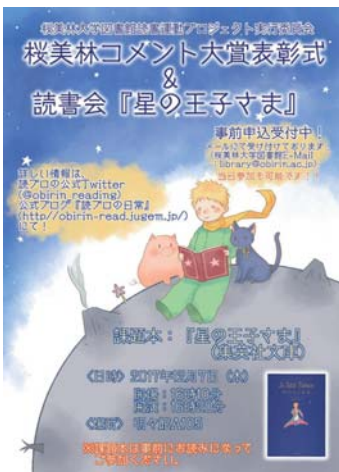
コメント大賞のポスター

12月7日に読プロ主導のもと「コメント大賞表彰式」と「星の王子さま読書会」を行いました。第1部では、生協に提出されたコメントマラソンのコメントカードから投票により賞を決め表彰する表彰式を行いました。今年の大賞はペンネーム「ひろ」さんの『教団X』でした。そして第2部では、『星の王子さま』を課題本とした読書会を行いました。このイベントでは図書館館長をはじめ、図書館職員の方々、生協理事長、大学の先生方や学生さんに参加していただきました。読書会前半では4つのグループに分かれ、普段あまり聞くことが出来ない先生方や大人の人の意見を聞くことで多くの発見や多様な見方ができ、後半ではそれぞれ「自分の星」を紙に書き、グループ内でシェアしました。全体を通してとても有意義なイベントになりました。