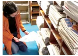
バックナンバーを選ぶ

内容：就職活動に役立つ新聞の読み方を提案する、図書館1Fの新聞バックナンバーの所蔵エリアを見学する、気になる新聞記事を選び参加者同士で内容を共有する、という3つ取り組みをワークショップ形式で行いました。