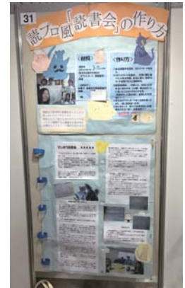
ポスターセッション 「読プロ風読書会の作り方」