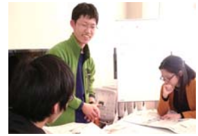
気になる記事を発表し合う