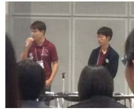
壇上でスピーチする 読プロメンバー

11月に横浜のみなとみらいパシフィコ横浜で第19回図書館総合展が行われ、読プロはポスターセッションと全国学生協働サミットに参加しました。2回目の参加となるポスターのテーマは「読プロ風読書会の作り方」。ポスターをレシピ風にし、二枚の模造紙を重ね、横に閉じたり開いたりできるようにしました。上半分には用意する物・やり方を、下半分には実際行った読書会の記録を書き直して作りました。全国学生協働サミットでは、フォーラム・交流会への参加のほか、読プロの主な活動についてスピーチしました。他大学との交流やさまざまな企業・図書館のブース見学ができ、充実したひとときでした。また、初めてキャラクターグランプリにも応募し、読プロのキャラクター「トントン」がエントリーしました。