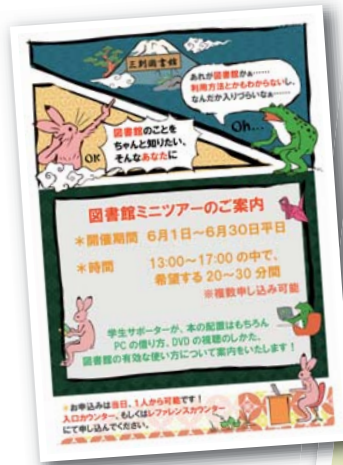
「ミニツアー」ポスター