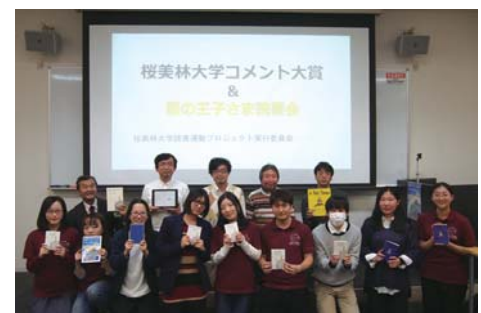
読書会後全体の集合写真