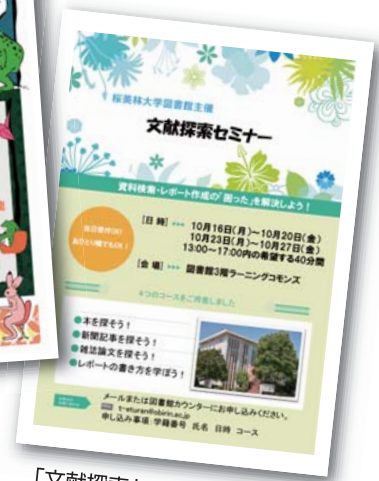
「文献探索セミナー」ポスター