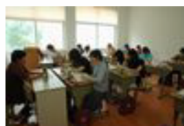
同済大学授業風景