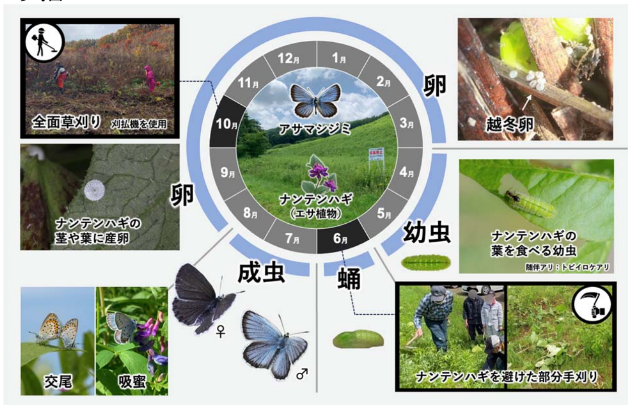
図1 研究概要 (アサマシジミ北海道亜種の生活サイクルを踏まえた草刈り時期と方法)