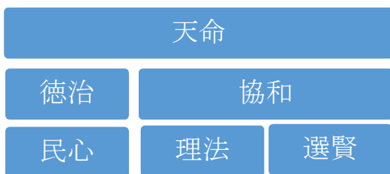
図2 筆者作成：三層説から改造された六部説