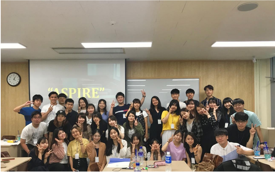
図 2: UNAI ASPIRE Japan 並びに UNAI ASPIRE Korea の面々