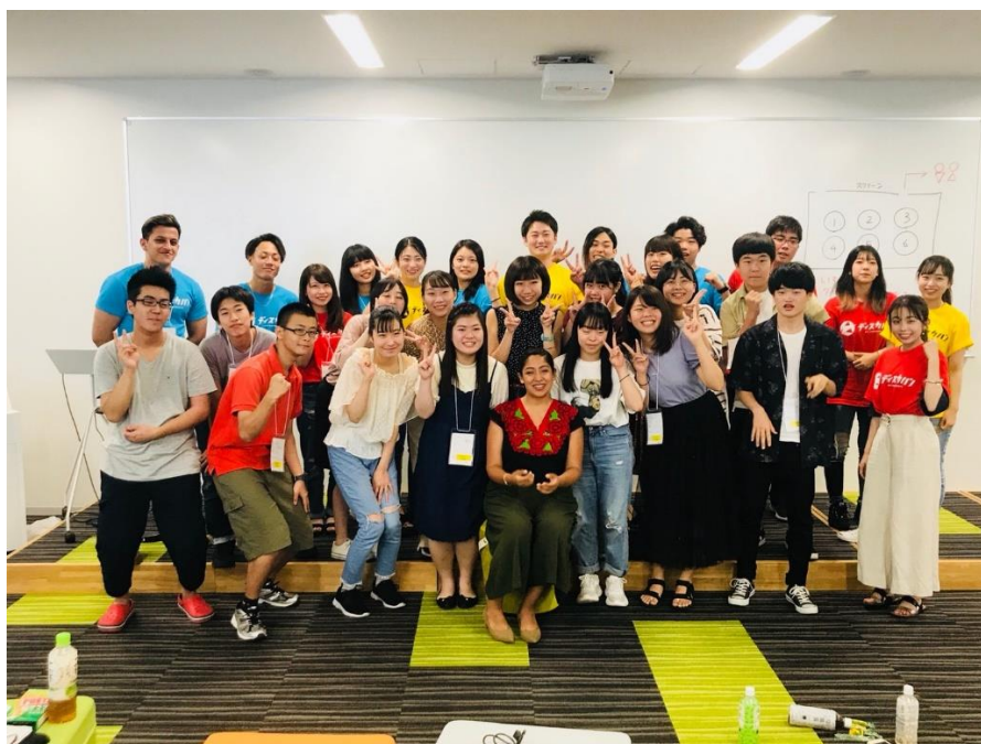
図4: 参加者の集合写真

https://discova.jp/program/19summer-7/ (accessed 2023-03-25)