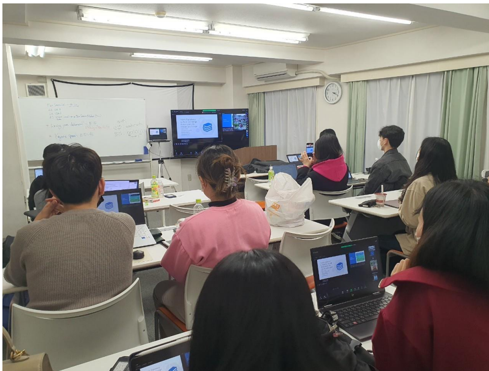
図 19：貸会議室での学習活動の様子