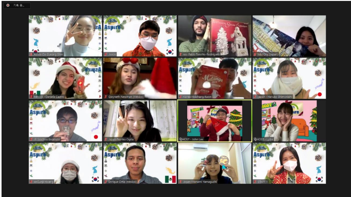
図 17：オンライン国際会議の様子（日本、韓国、メキシコ、コロンビアの学生団体）