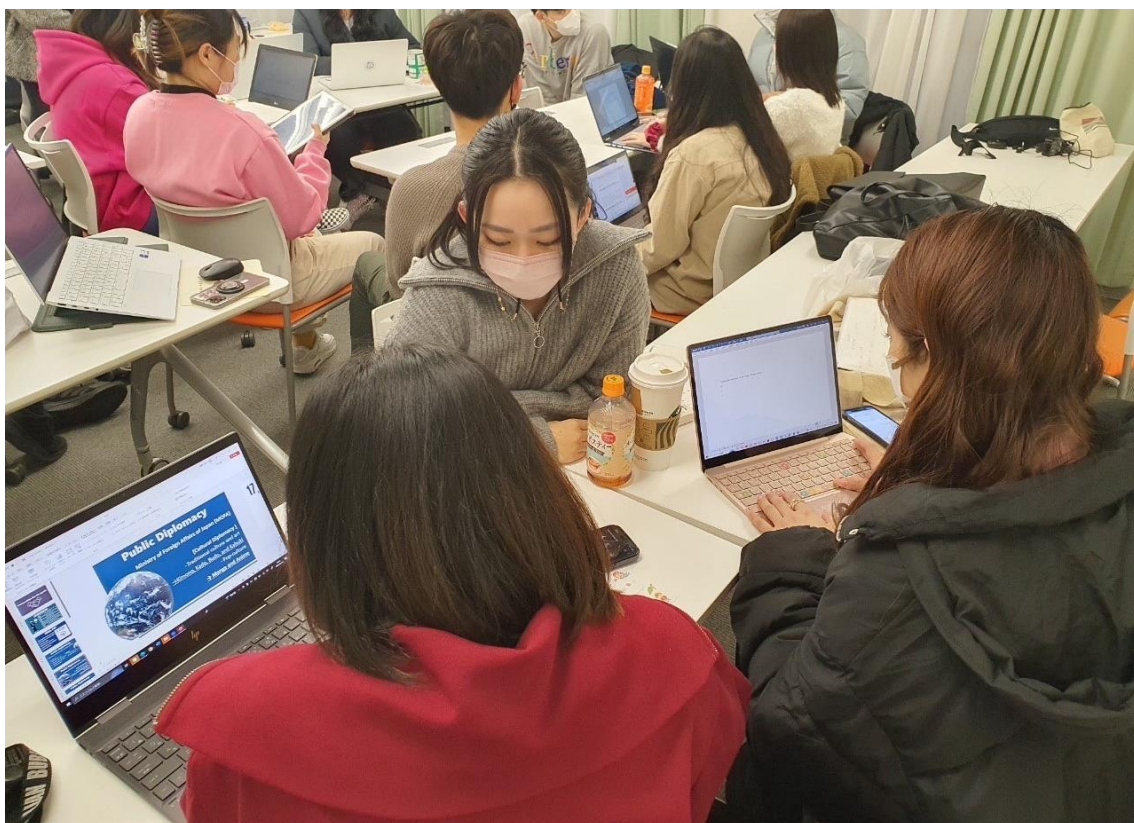
(図1：参加学生のグループワークの様子)

筆者は、過去にUNAI ASPIRE Japanの代表を務め、現在は桜美林大学大学院に所属をしている。The 8th Goodwill Sessionでは、一人の参加者であると同時に、これまでの経験を活かしてコーディネーターの補佐役を担った。本稿は、補佐役の観点から見たUNAI ASPIREの活動の参加記録である。