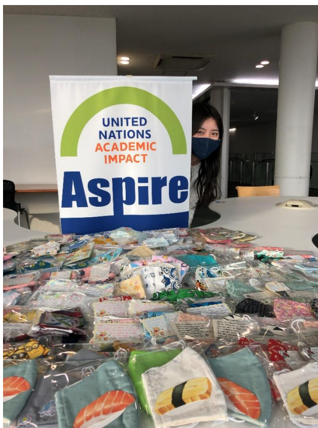
図 15:マスクプロジェクトの企画代表者と提供頂いたマスク

リカのサンフランシスコ（カリフォルニア州）の貧しい子どもたちにマスクを送るために行った。コロナ禍の中で、大学での学びだけでなく、ボランティア活動の機会も失われ、人との繋がり構築も困難になっている中で、今のこの環境だからこそ出来る社会貢献と繋がり作りをしたいという想いのもの始められている。元々は、海外サービスラーニング（アメリカ社会活動）のオンラインボランティア活動の一部として実施されたが、大学全体にも周知し、およそ200枚の手作りマスクを集め現地に届けることができた。