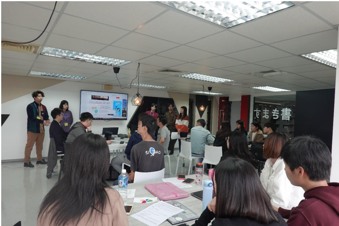
図 8 ; 日台の学生間の交流