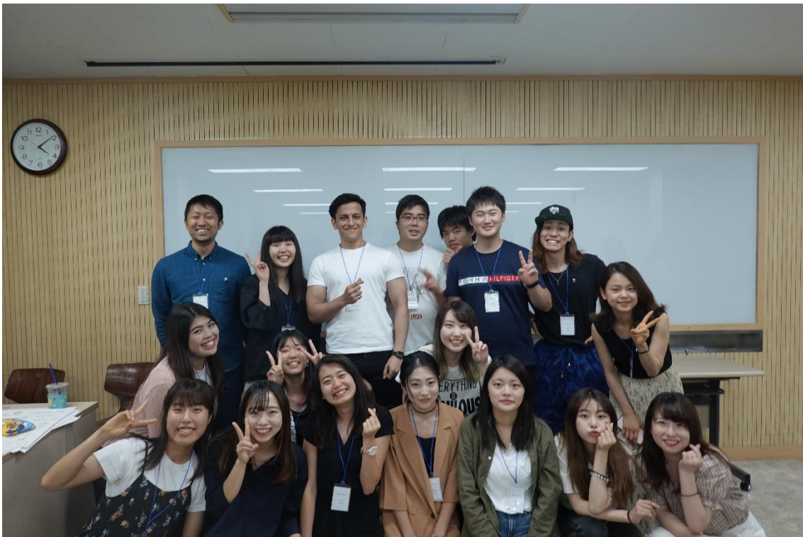
図 3: UNAI ASPIRE Japan (桜美林) の面々