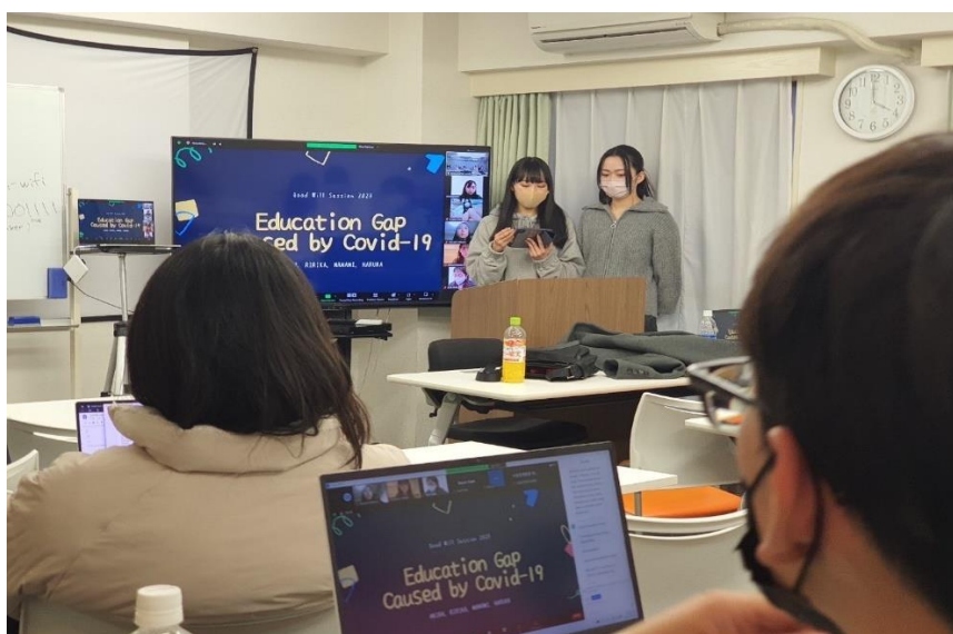
(図 2：発表中の ASPIRE JAPAN の学生)

グループ 2：MBTI 診断を利用して、世界におこる教育格差を解決し、「持続可能な社会をどうつくるか」を主体的に学び、考え、保護者や地域に住む地域住民が協力して運営する仕組みについて発表をした。MBTI 診断とは、Myers-Briggs Type Indicator の頭文字とを取ったもので、16 個の性格から分類を試みるものであり、日韓の若者を中心に流行っている心理測定の一つである。それぞれに合った教育の在り方とその可能性について考察を試みた。なお、桜美林大学は 2023 年 4 月に教育探究科学群を設立され、ここでも本人の好奇心や個性を最大限に活かす試みがなされようとしている。自分の個性やキャラクターを理解する上でも、こうした心理測定は一つの指標になると言える。