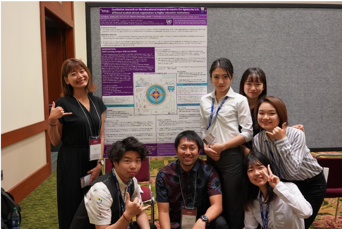
図 9:ポスター発表者の ASPIRE Japan メンバーとコーディネーター