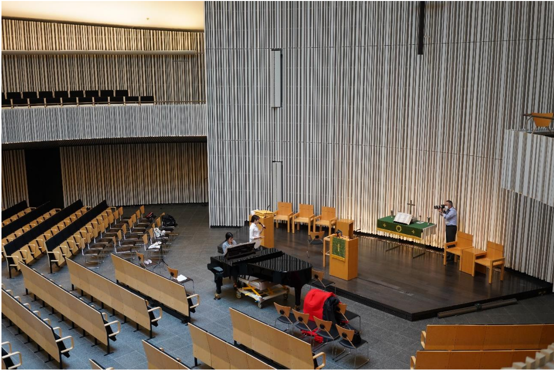
図 14：ピアノ演奏に合わせて歌っている様子