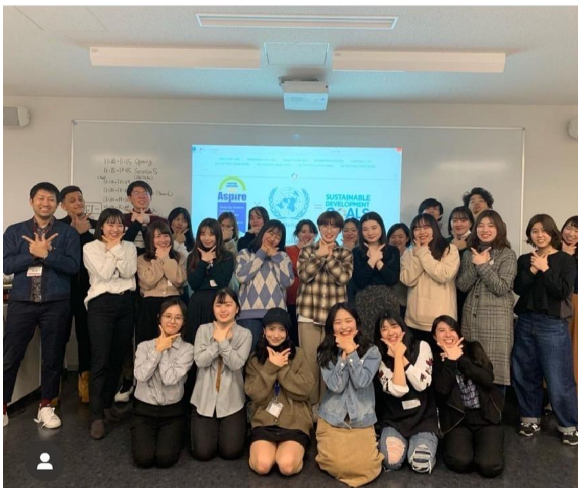
図 12 : Goodwill Session の参加者の集合写真