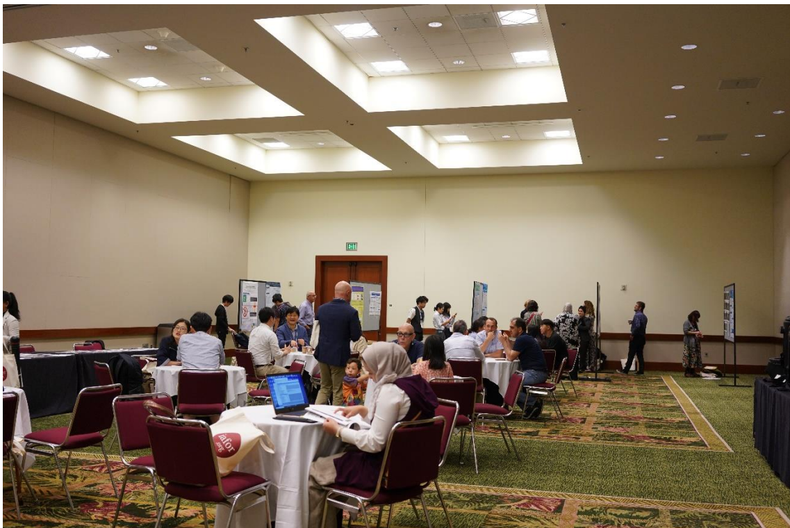
図 10: 発表会場の様子