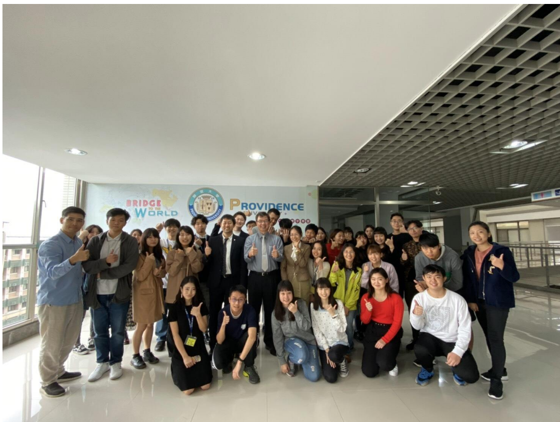
図7：静宜大学の教職員と ASPIRE Japan のメンバー