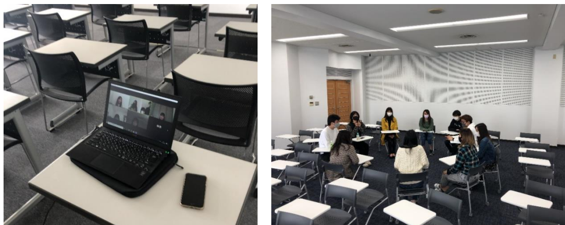
図 16 : ハイブリット型によるイベント実施の様子