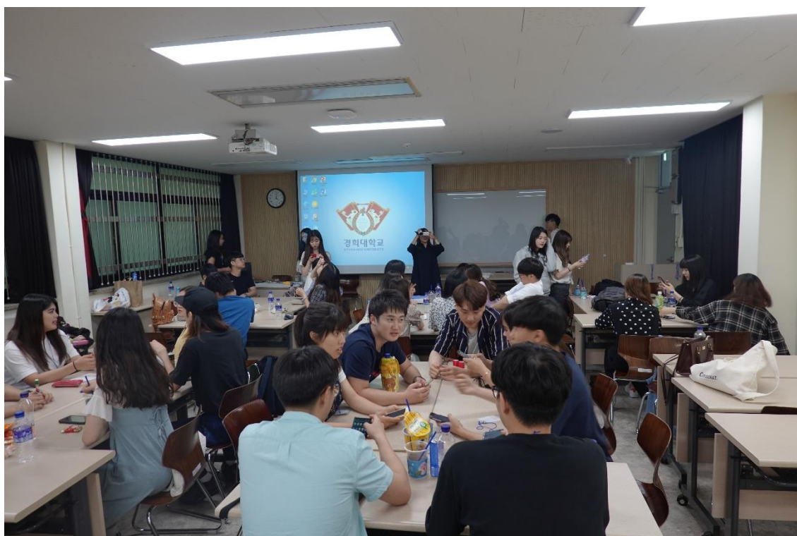
図 1: 質疑応答や議論の様子