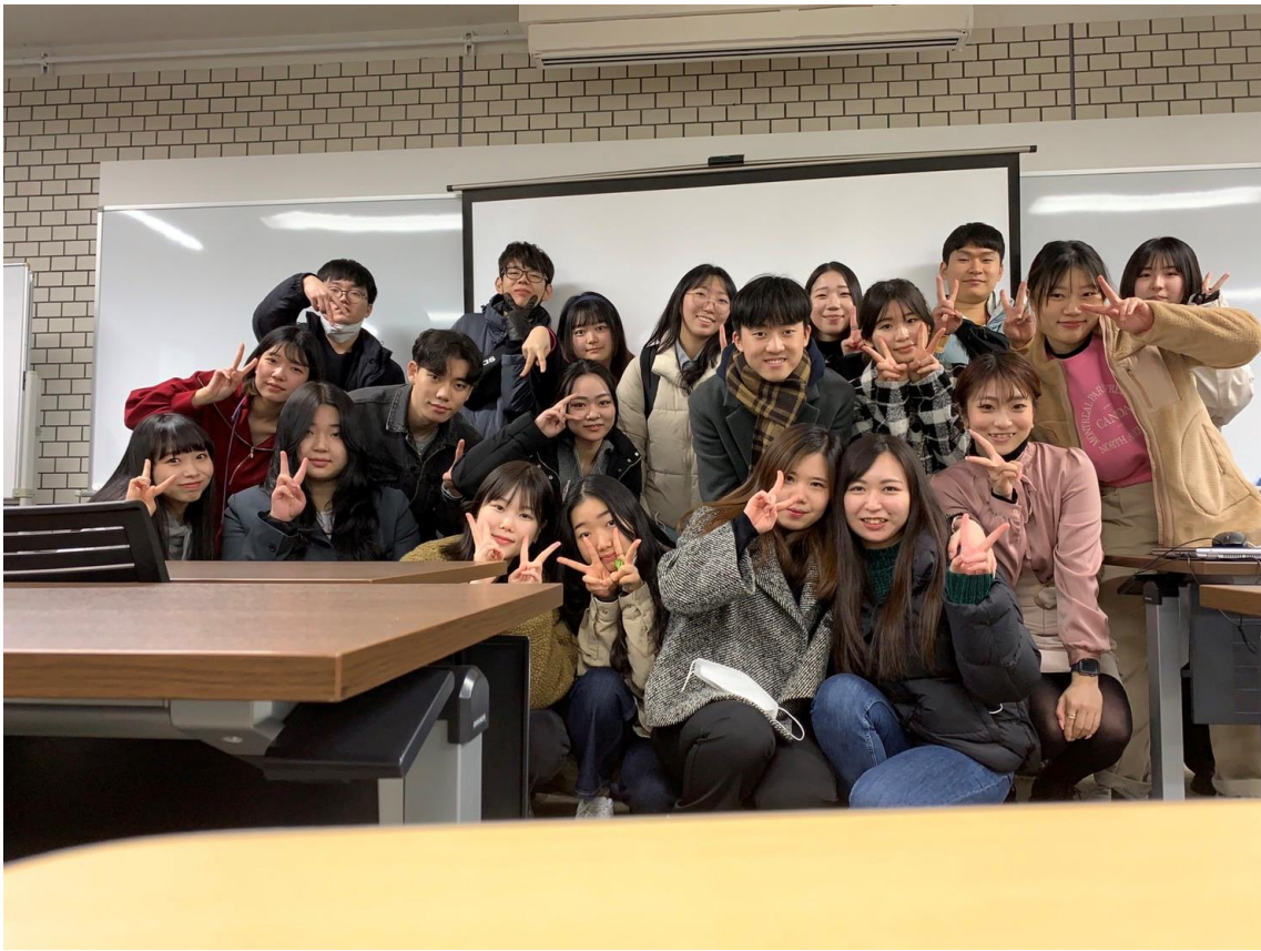
(図3：セッション2日目の集合写真)