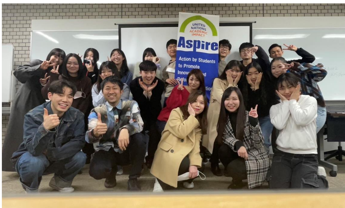
図 18: セッション終了時の ASPIRE Japan と Korea の学生による集合写真